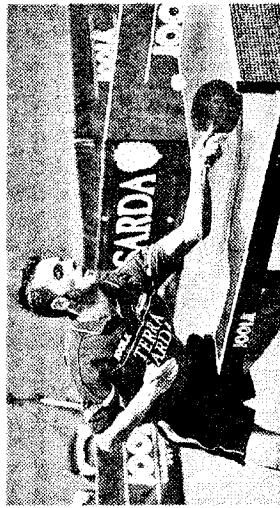
Incontri interessanti per le squadre oristanesi nei campionati di tennis tavolo

sciano l'ultima posizione in classifica al Sardegna Guspini e allo Sporting Lanusei B e quando mancano quattro giornate alla fine del torneo si allontana dalla zona retro-